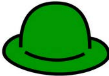
Creatividad Alternativas y propuestas