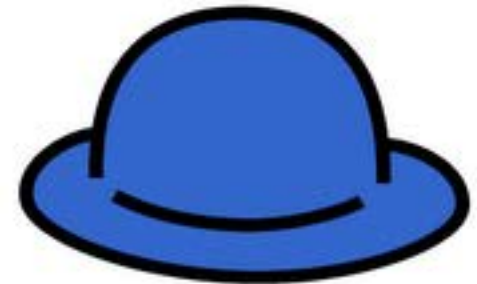
Visión global Director de orquesta