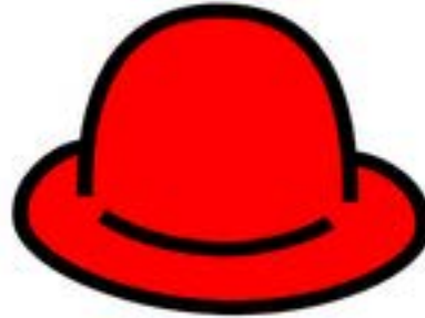
Intuición Emoción y sentimientos