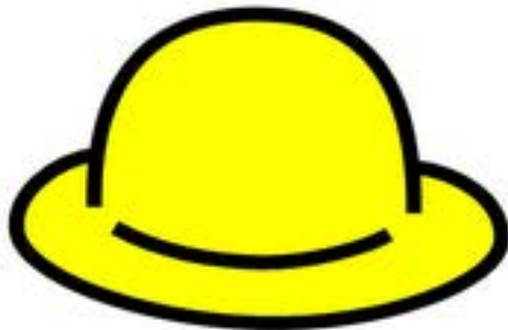
Lógica positiva Beneficios y ventajas