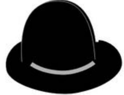
Voz del juicio Análisis crítico